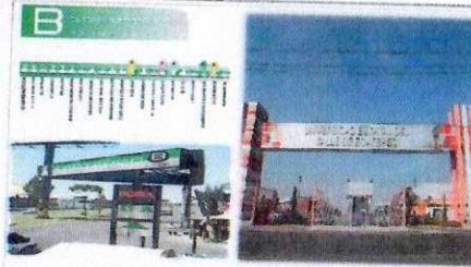
Estacion del Metro Ecatepec