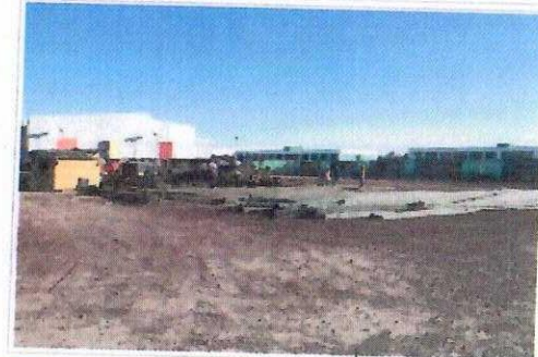
F5: Interior de aula