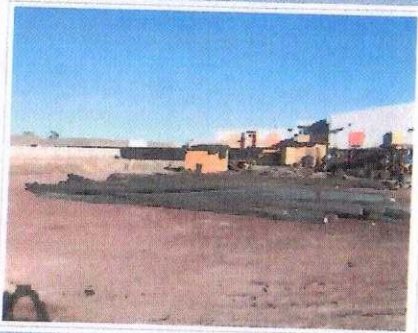
F3: Fachada posterior