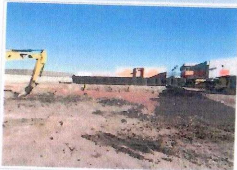
F1: Fachada principal