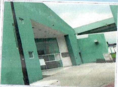
F1: Fachada principal

AV HANK GONZALEZ SIN ESQ. LEONA VICARIO COL. VALLE DE ANAHUAC, C.P. 55230