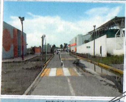
F3: Fachada posterior