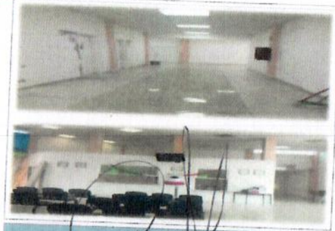
F5: Interior de sala