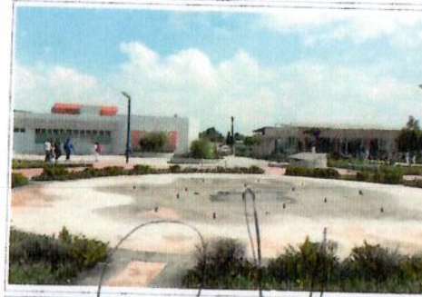
F5: Interior de aula