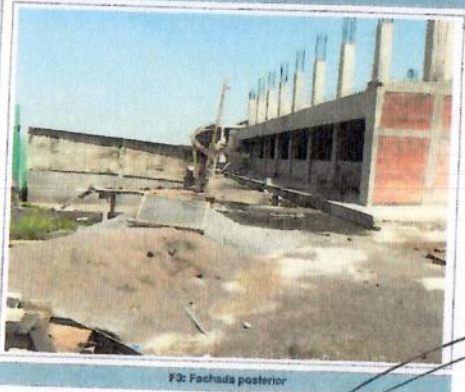
F3: Fachada posterior