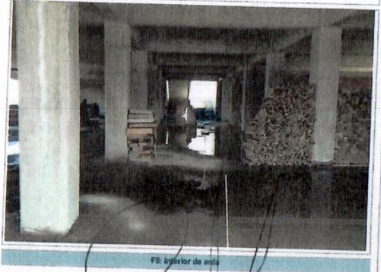
F5: Interior de aula

Comentarios de los trabajos realizados: PENDIENTE POR INICIO DE LA 3ª ETAPA