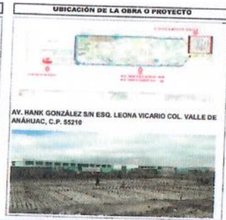
UBICACION DE LA OBRA O PROYECTO