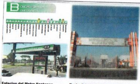
Estacion del Metro Ecatepec Fachada Principal de la Entrada