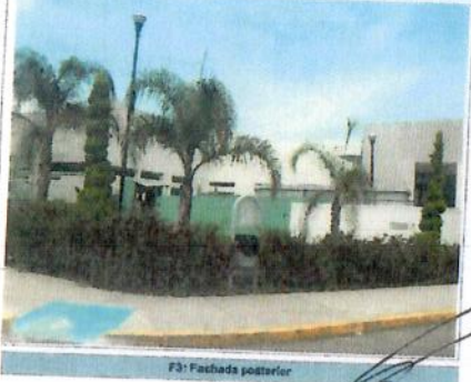
F3: Fachada posterior

Comentarios de los trabajos realizados: PENDIENTE POR LA FIRMA DEL CONTRATO DE CSRA