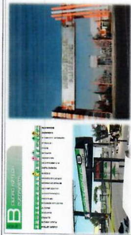
Fecha Principal de la Entrada Estacion del Metro Ecatepec