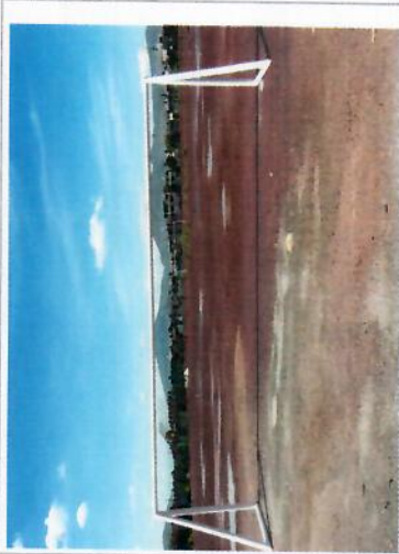
F1: Fachada posterior