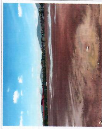
F3: Fachada posterior